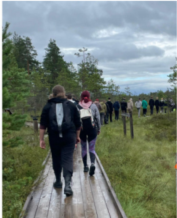
Lukuvuosi käynnistyi Novidassa uusien opiskelijoiden ryhmäytymisillä.